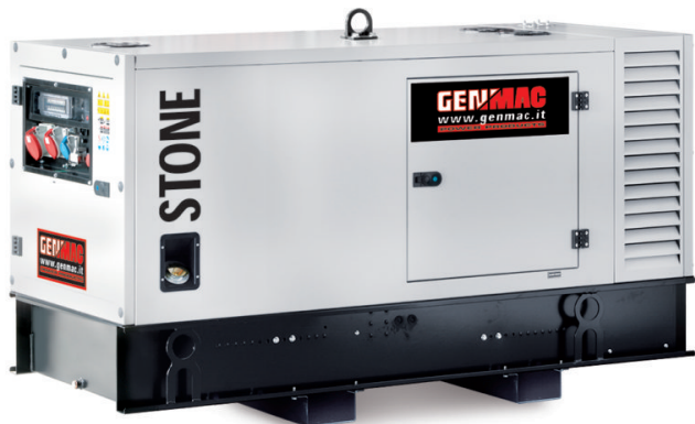
Изображение только для иллюстрации

Генератор в кожухе со следующими структурными характеристиками: